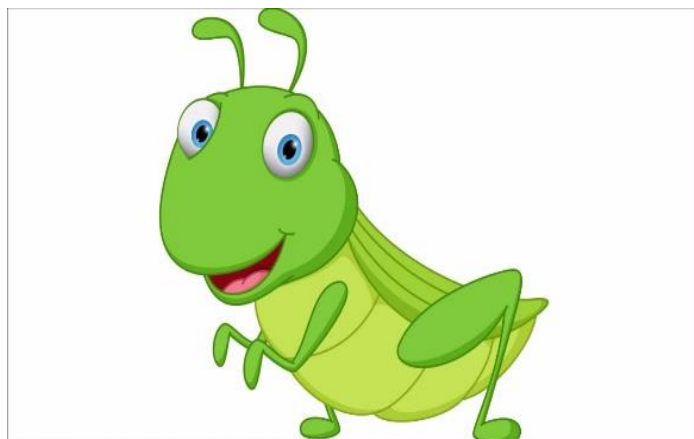
pasikonik – zielony