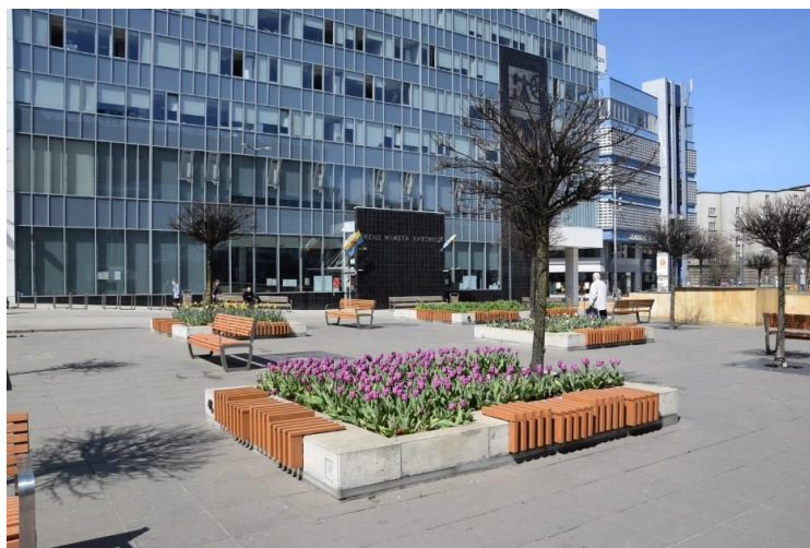
Rynek w Katowicach