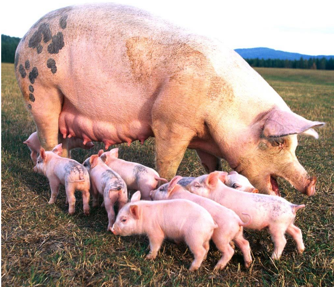
MACIORA I PROSIĘTA