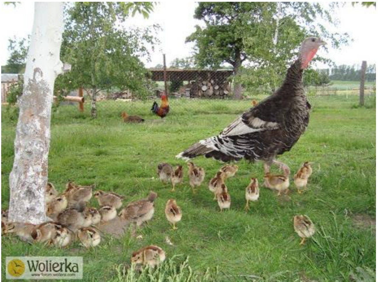
INDYCZKA I INDYCZĘTA