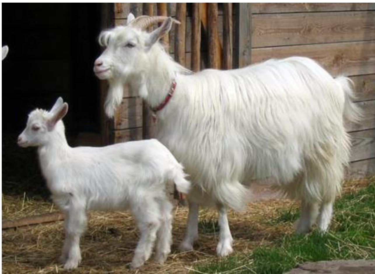
KOZA I KOŻŁĘ