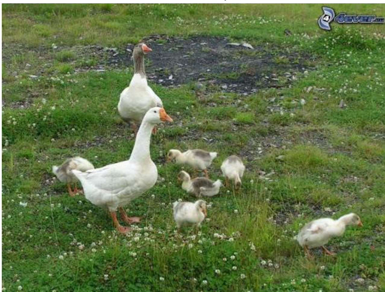
GEŚI I GEŚIĘTA