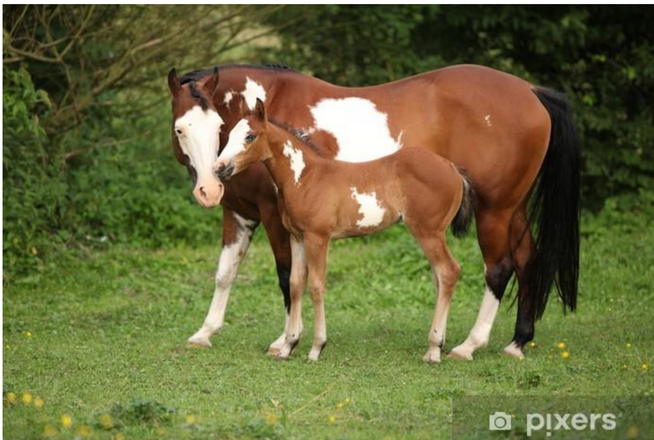
KLACZ I ŻREBIĘ