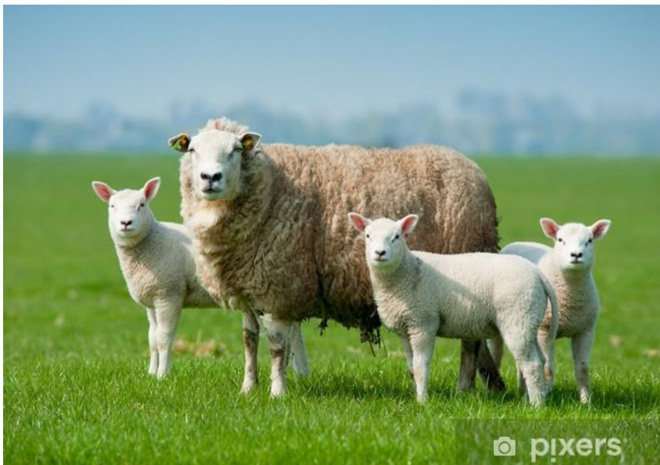
OWCA I JAGNIĘTA