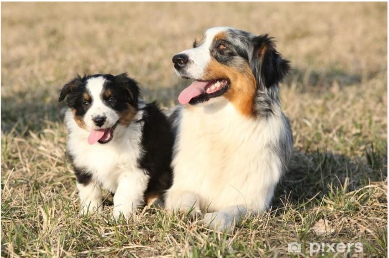
SUKA I SZCZENIĘ