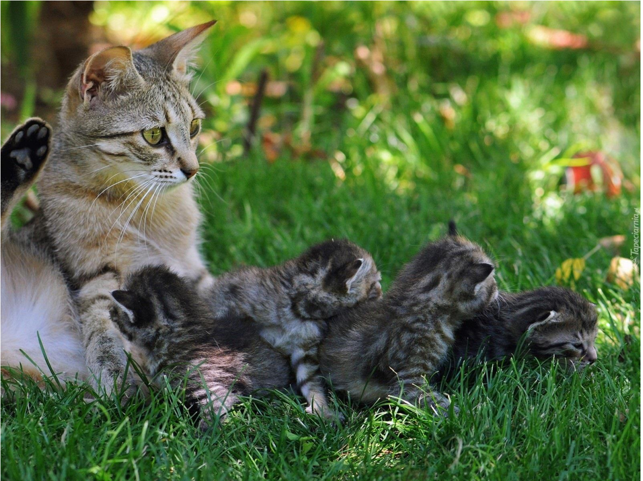
KOTKA I KOCIĘTA