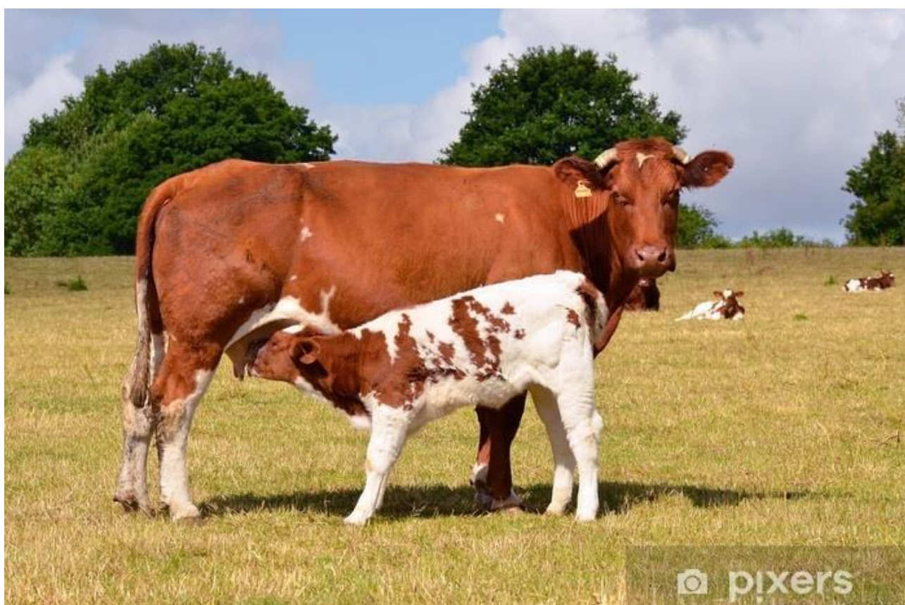
KROWA I CIEŁĘ