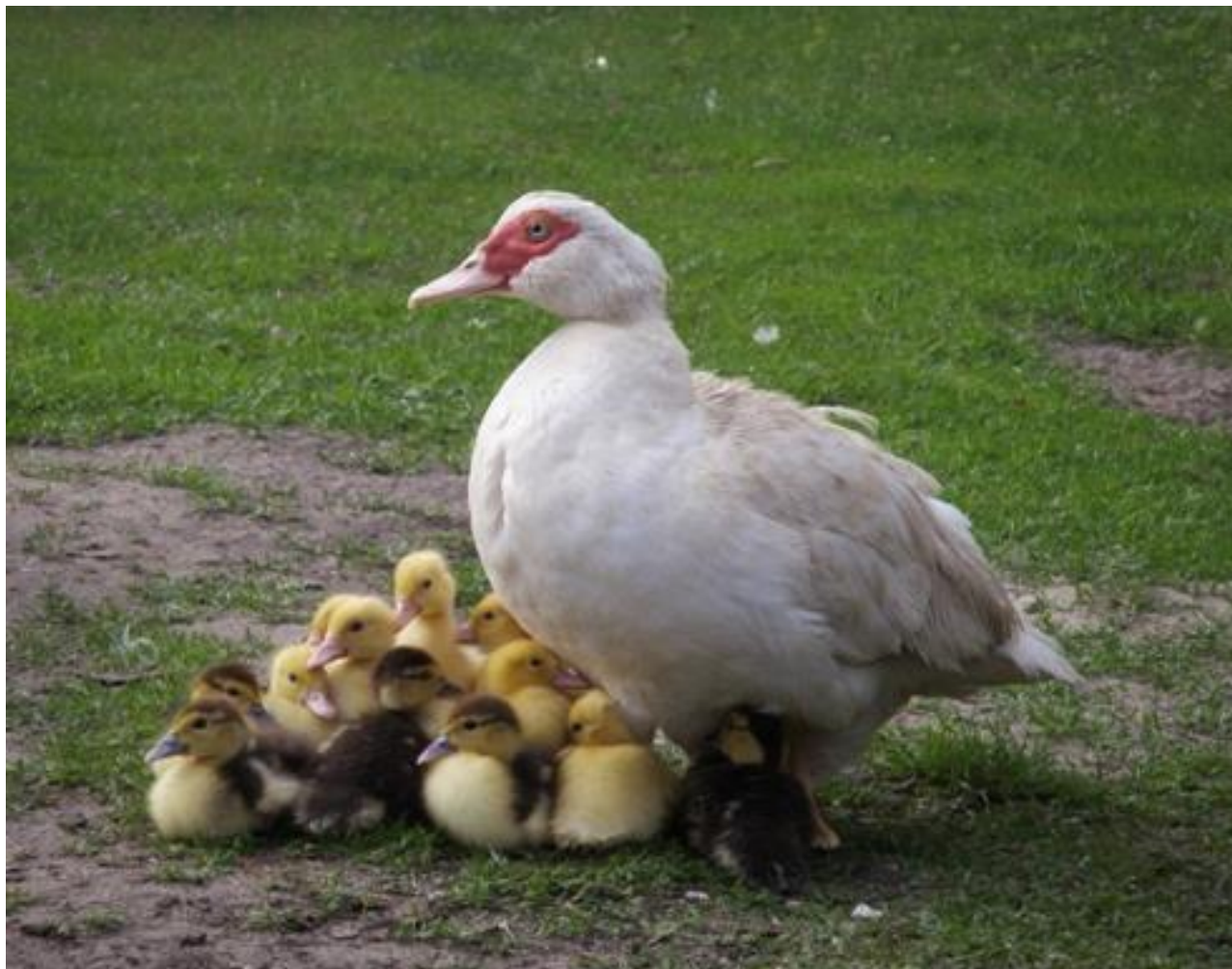
KACZKA I KACZĘTA