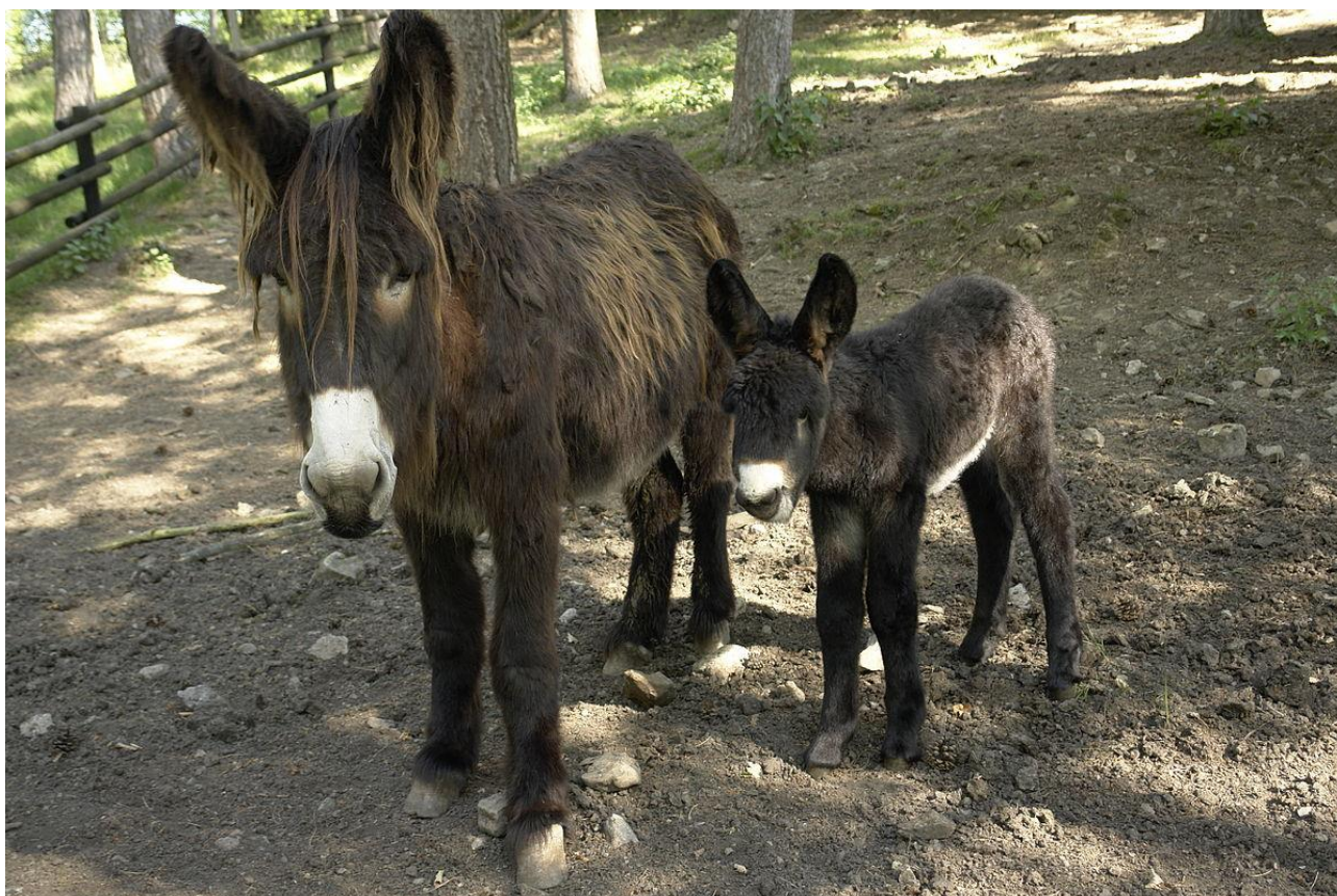
OŚLICA I OŚLĘ