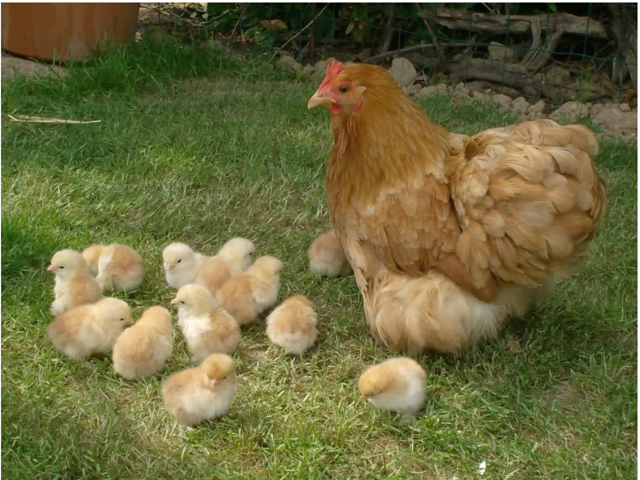
KURA I KURCZĘTA